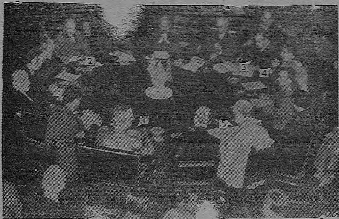
Los delegados de las tres potencias inauguran la Conferencia de la Victoria en el Palacio de Potsdam. En esta foto se ven el Presidente Truman (1), el primer Ministro Churchill (2), el Mariscal Stalin (4), Molotov (3) y el Almirante Leahy.

SE ANUNCIA QUE DE LA CONFERENCIA SALDRA EL ULTIMATUM CON LOS TERMINOS DE RENDICION Y QUE DE SER RECHAZADO, RUSIA ENTRARA EN LA GUERRA CONTRA JAPON